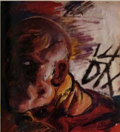
Otto Dix, Autoportrait en soldat , 1914