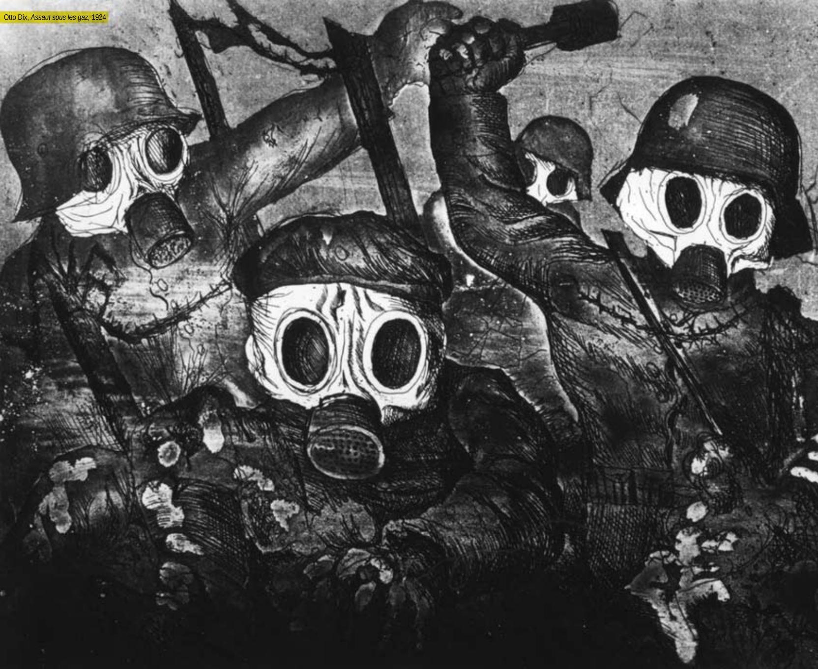
Otto Dix, Assaut sous les gaz, 1924