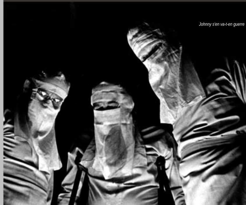
Johnny s'en va-t-en guerre