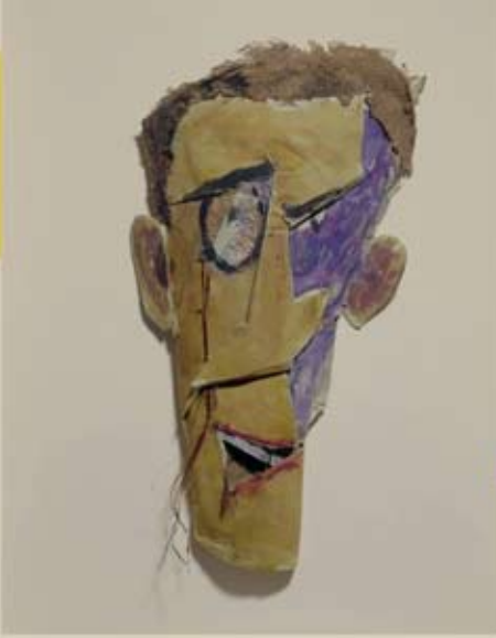
Marcel Janco, Masque Dada , 1918

Avec le Centre Franco-allemand de Provence - 04 42 21 29 12