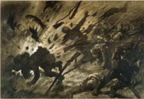
George Bertin Scott, Effet d'un obus dans la nuit , 1915